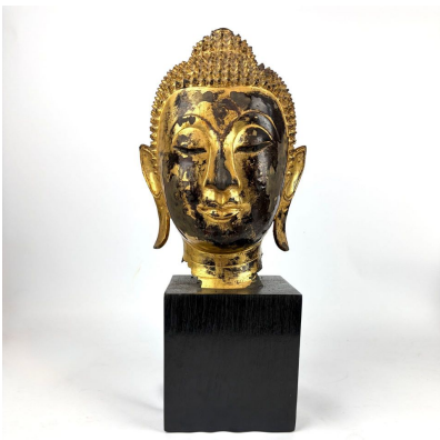
259 THAÏLANDE XIXe siècle Tête de bouddha en bronze laqué or, les yeux mi-clos, la coiffe finement bouclée et surmontée de l'ushnisha. H. 39 cm