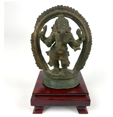
263 INDE XIXe siècle Statuette de Ganesh en bronze à patine brune debout à quatre bras sur un socle et nimbé. (Accidents). H. 11 cm