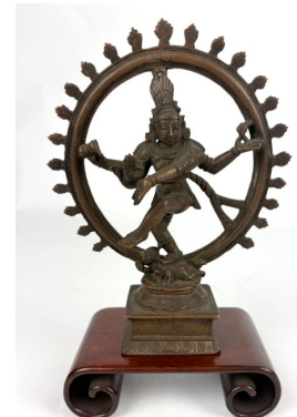
264 INDE XXe siècle Statuette de Shiva Nataraja, debout sur une jambe sur le démon de l'ignorance couché sur un socle, dans l'auréole flammée. H. 19 cm Socle en bois rapporté