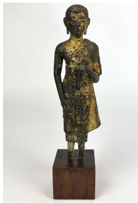
261 THAÏLANDE, Ratanakosin Vers 1900 Statuette de moine debout en bronze laqué or, la main droite posée sur sa cuisse, la main gauche initialement tenant un objet maintenant manquant. (Usures, manque les pieds). h. 16 cm