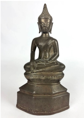
260 THAÏLANDE XIXe siècle Statuette de bouddha Maravijaya en bronze à patine brune, assis en virasana sur un socle en forme de lotus posé sur une base, la main droite en bhumisparsa mudra (geste de la prise de la terre à témoin). (Gerce restaurée à l'arrière). H. 28 cm