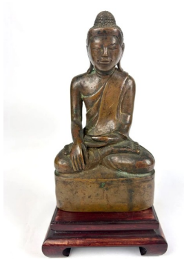
262 BIRMANIE, MANDALAY XIXe siècle Statuette de bouddha Maravijaya en bronze, assis en padmasana sur un socle, la main droite en bhumisparsa mudra. H. 15,5 cm