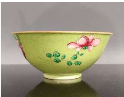
20 CHINE XXe siècle

Bol en porcelaine à décor en émaux polychromes de fleurs épanouies sur fond vert clair sgraffiato. Diam. 17 cm