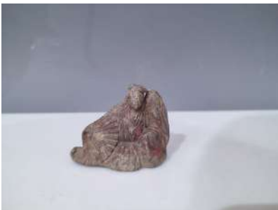
46 JAPON XXe siècle

Groupe en bronze figurant une femme assise, accoudée, un éventail dans sa main droite. (usures) H. 5 cm