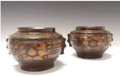
45 JAPON XXe siècle

Paire de pots en bronze à patine brune et traces de dorure, à décor incisé de masques de taotie et motifs de leiwen. H. 11,5 cm