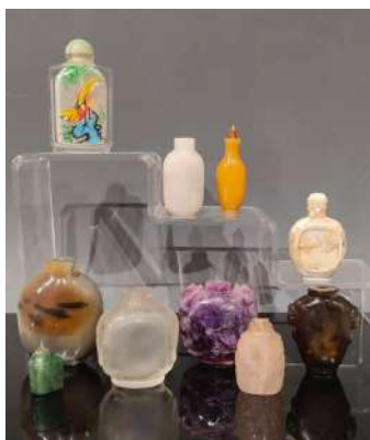
10 CHINE Ensemble de dix flacons tabatières, dont deux en verre imitant l'agate, un en verre peint à l'intérieur de perruches, l'un en verre blanc opaque, deux en vristal de roche, un en quartz vert aventuriné, l'un en nacre, l'autre en améthyste sculptée à décor en relief sur les côtés de qilong, l'un en pierre noire et grise. (Accidents. éclats et manques). Estim. 100/150 €