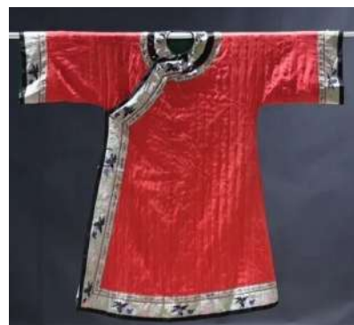
17 CHINE Vers 1900 Veste en soie rouge damassée et molletonnée de fleurs, les manches et bordures ornées de bandes de soie brodées de carpes. (Accidents). On y joint un chapeau en soie noire à décor de papillon. Estim. 200/300 €