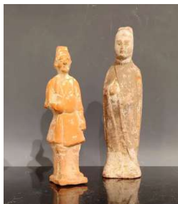
1 CHINE Epoque TANG (618-907) Deux statuette de personnages debout en terre cuite. Haut. 41 et 20,5 cm