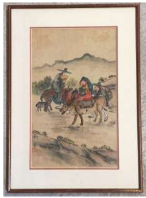
47 COREE XXe siècle

Encre sur papier, couple à cheval avec enfant. Dim. à vue 41,5 x 25,5 cm. Encadré sous verre