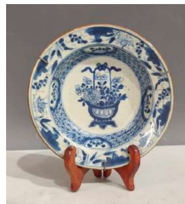
3 CHINE XVIIIe siècle Assiette en porcelaine décorée en bleu sous couverte d'un panier fleuri au centre entouré de fleurs. Diam. 16,5 cm