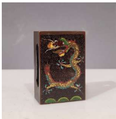
15 CHINE XXe siècle Poids de forme rectangulaire en bronze et émaux cloisonnés à décor d'un dragon sur fond noir. Dim. 6x4x2 cm Estim. 40/50 €