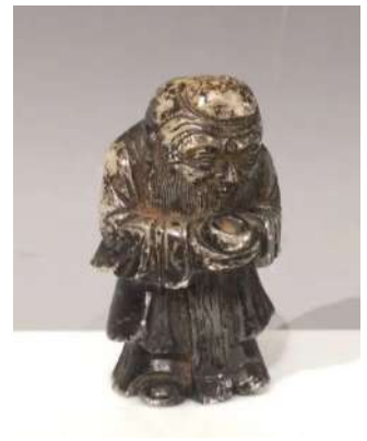
22 CHINE Début XXe siècle

Petit groupe en néphrite partiellement laquée, Shoulao debout tenant une pêche de longévité. H.5 cm