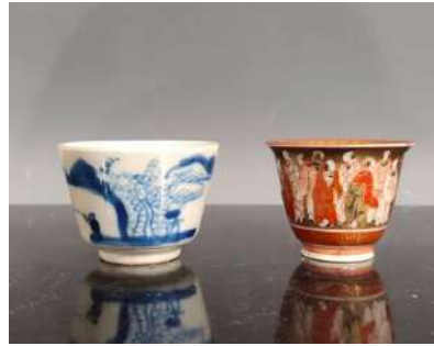
33 JAPON, Fours de Kutani Epoque MEIJI (1868 - 1912) Sorbet en porcelaine à décor en émail rouge de fer et or de rakan. (fêlure)