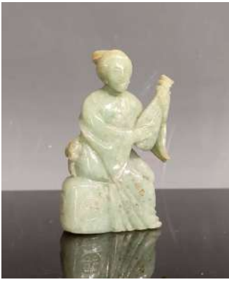
24 CHINE XXe siècle

Groupe en jadéite verte, jeune femme assise jouant du pipa. H. 7,5 cm