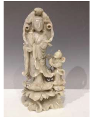
23 CHINE XXe siècle

Groupe en serpentine céladon et grise, Guanyin debout sur un socle en forme de fleur de lotus avec Shancai. (Accidents). H. 27 cm.