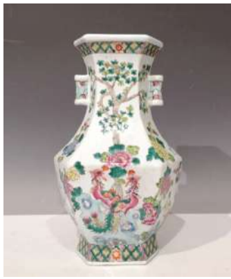
21 CHINE XXe siècle

Vase balustre hexagonal en porcelaine, à décor en émaux polychromes dans le style de la famille verte de phénix parmi les rochers sous les arbres. H.29 cm