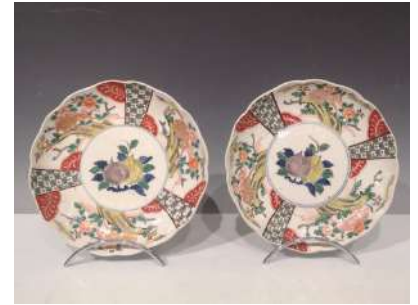
36 JAPON XIXe siècle Paire de coupes polylobées en porcelaine à décor en émaux polychromes de pêches au centre, l'aile ornée de motifs de brocarts et shishi dans les pivoines. Diam. 21,5 cm