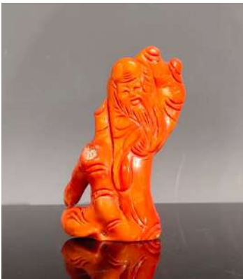
25 CHINE XXe siècle

Groupe en corail teinté rouge, Shoulao debout. H. 10 cm