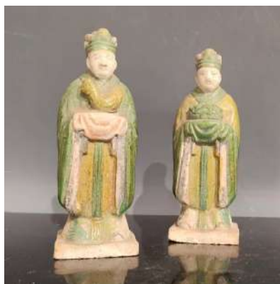
2 CHINE Epoque MING (1368 - 1644) Deux dignitaires en terre cuite émaillée vert. Haut. 18 cm