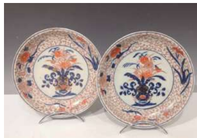
34 JAPON, Imari XVIIIe siècle Paire de coupes en porcelaine à décor en bleu sous couverte, rouge de fer et émail or de bouquets épanouis au centre, l'aile ornée de kiku parmi les rinceaux feuillagés. (restaurations au rebord) Diam. 24 cm