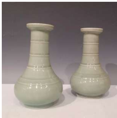
21,2 CHINE XXe siècle

Paire de vases bouteilles à larges col en porcelaine émaillée céladon, l'épaule ornée de trois stries et le col annelé. H. 20 cm