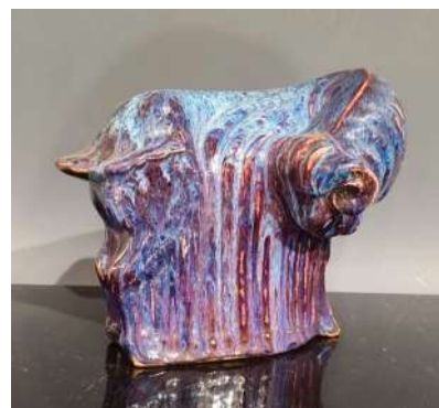
18 CHINE Vers 1900 Groupe en grès émaillé bleu et rouge flammé figurant un grand lingzhi, champignon de longévité. H. 17 cm Estim. 500/600 €