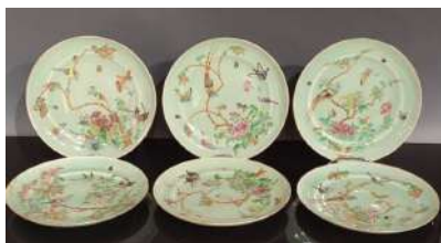
13 CHINE, Canton XIXe siècle Six assiettes en porcelaine céladon à décor en émaux polychromes d'oiseaux papillons et fleurs. Diam. 20 cm Estim. 80/100 €