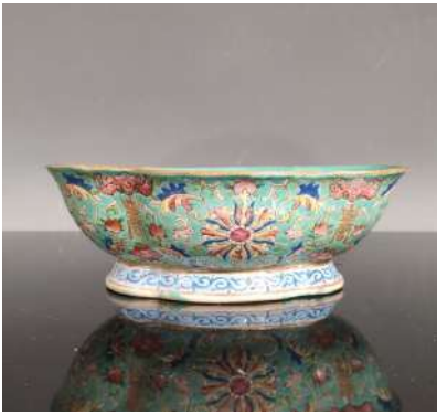
19 CHINE XIXe siècle Coupelle de forme polylobée en porcelaine émaillée polychrome à décor de fleurs de lotus sur fond bleu turquoise. Au revers, la marque de Tongzhi. L.