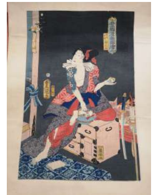
37 Toyokuni III (1786 -1865) Oban Tate-e, partie de triptyque jeune femme tatouée assise sur un coffre, une théière à la main, une épaule dénudée. Signé Toyokuni ga. Dim. 35,5 x 24 cm